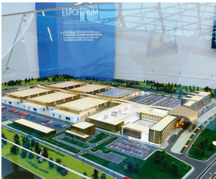
Макет Конгрессно-выставочного центра «ЭКСПОФОРУМ»

– Поделитесь, пожалуйста, планами развития Ярмарки. В частности, когда планируется переезд ПТЯ в новый выставочный комплекс, параллельно с какими мероприятиями будет проходить Ярмарка в следующем году?