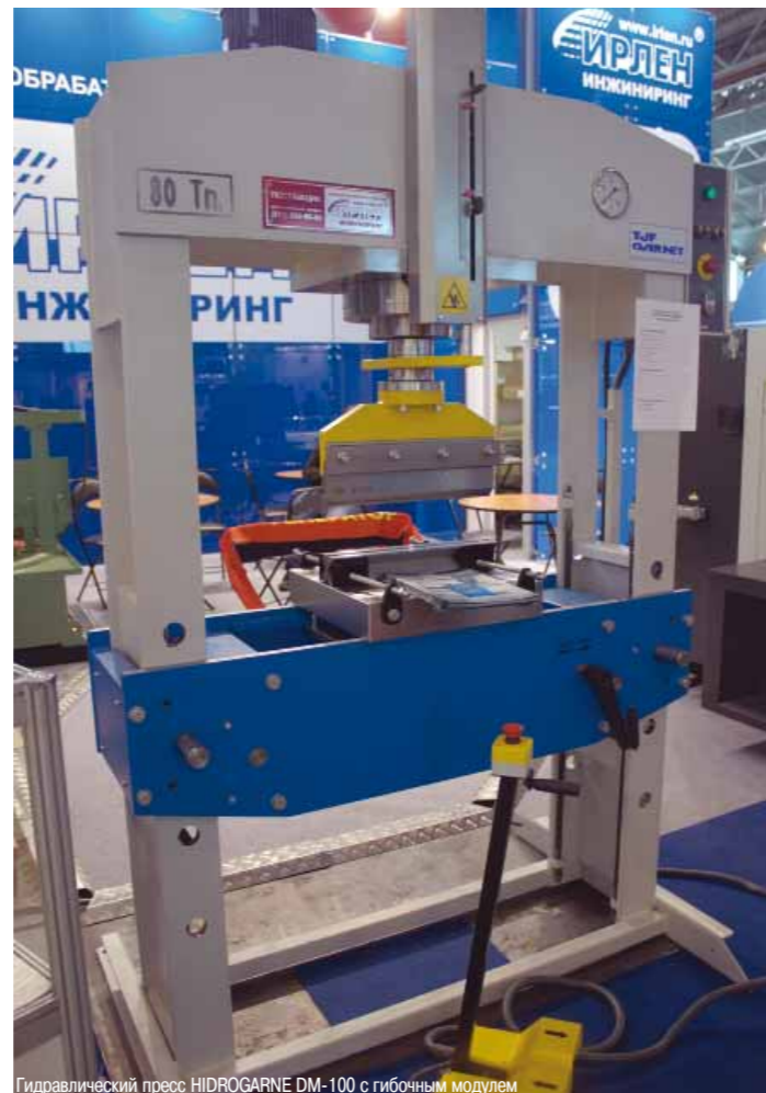
Гидравлический пресс HIDROGARNE DM-100 с гибочным модулем