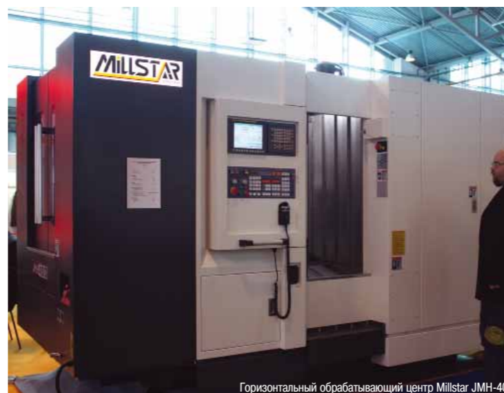
Горизонтальный обрабатывающий центр Millstar JMH-400