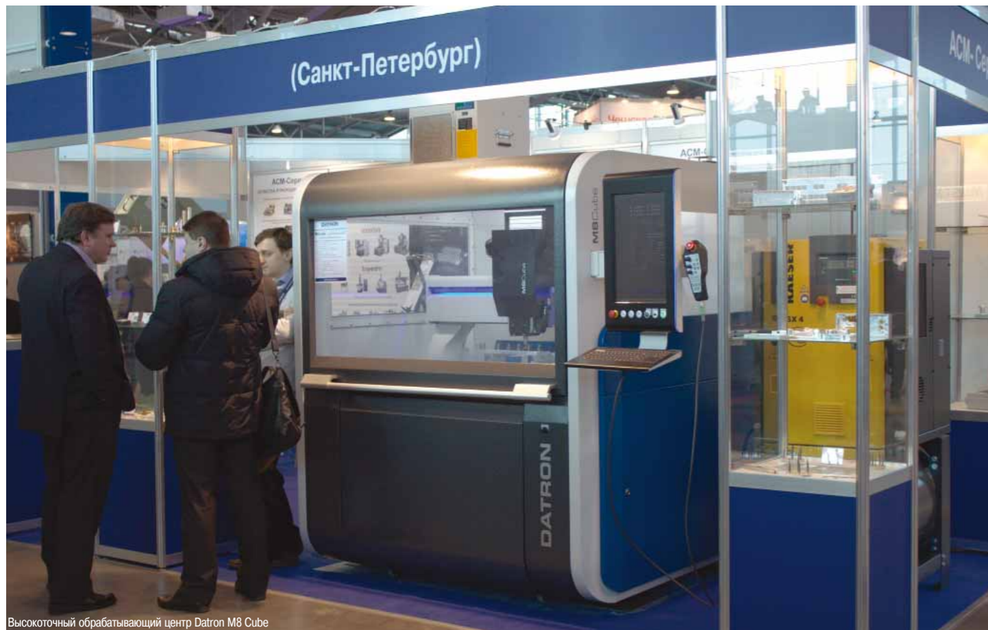
Высокоточный обрабатывающий центр Datron M8 Cube