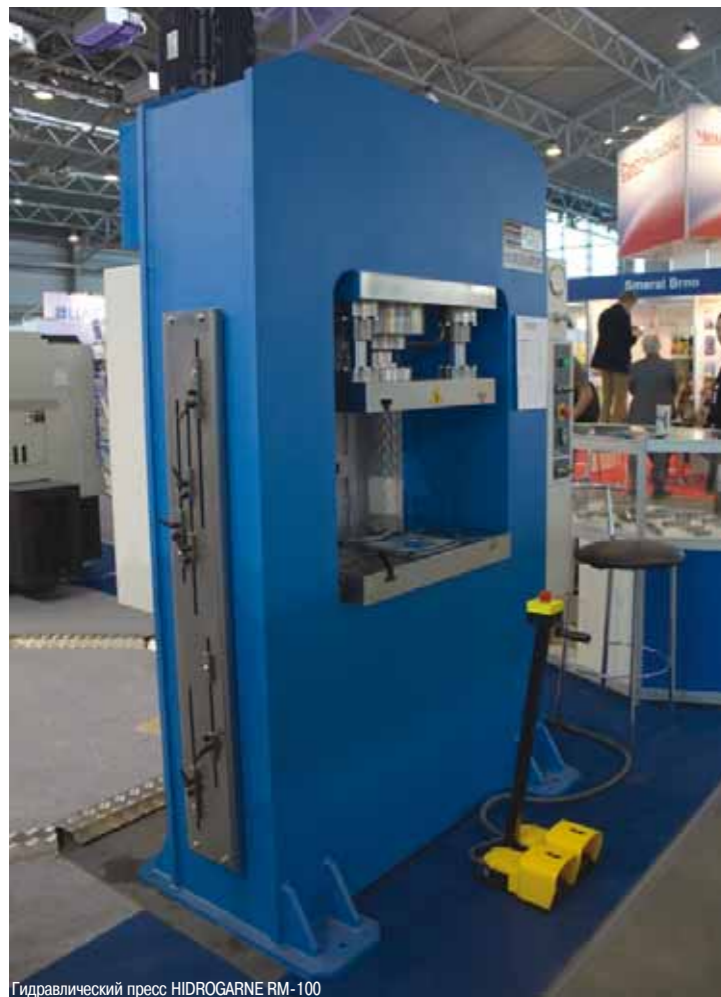
Гидравлический пресс HIDROGARNE RM-100