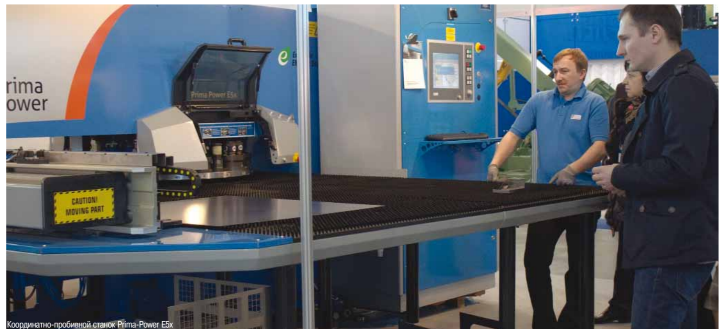
Координатно-пробивной станок Prima-Power E5x