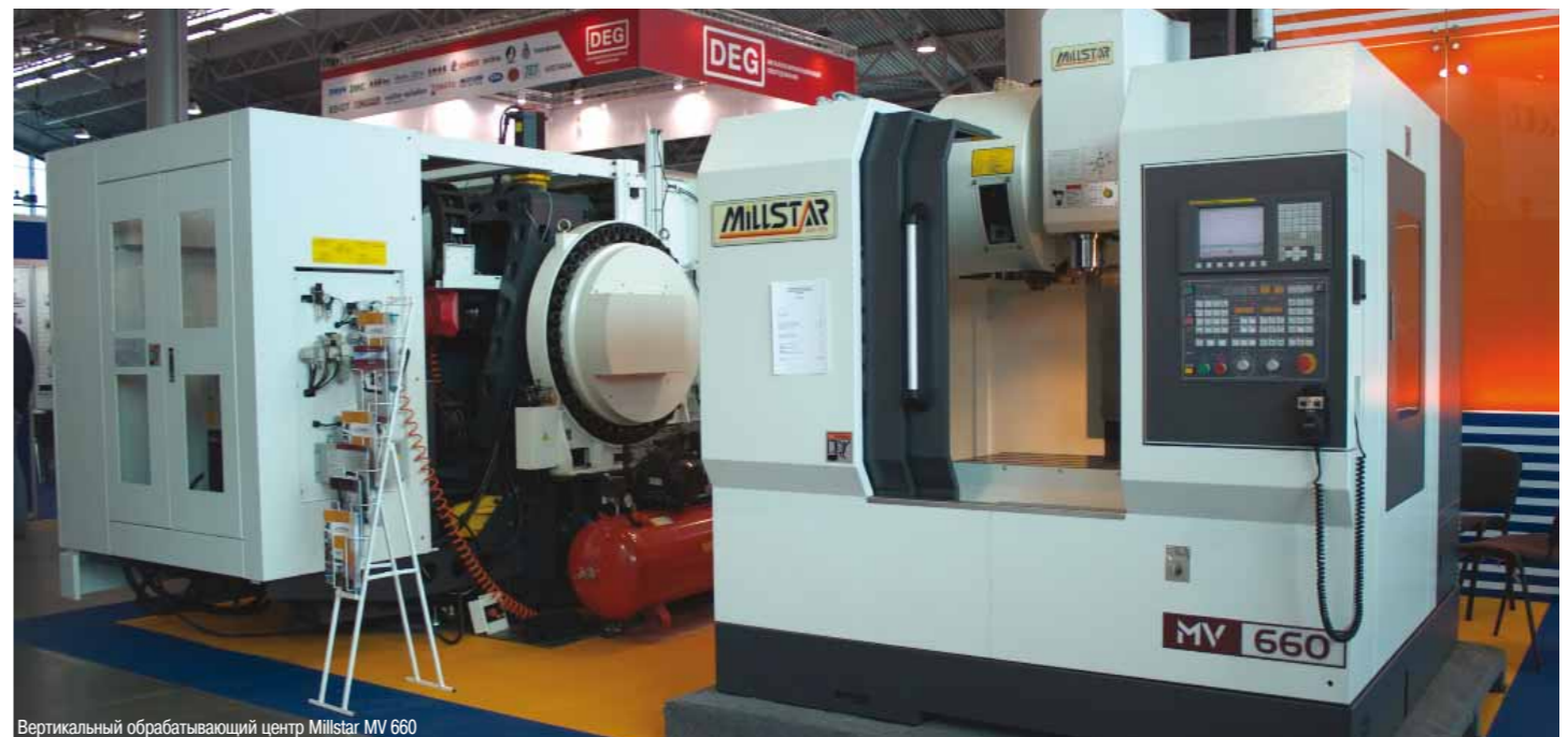
Вертикальный обрабатывающий центр Millstar MV 660