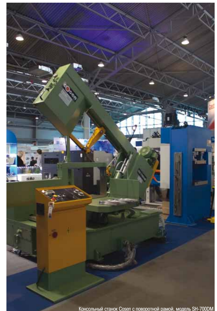
Консольный станок Copen с поворотной рамой, модель SH-700DM