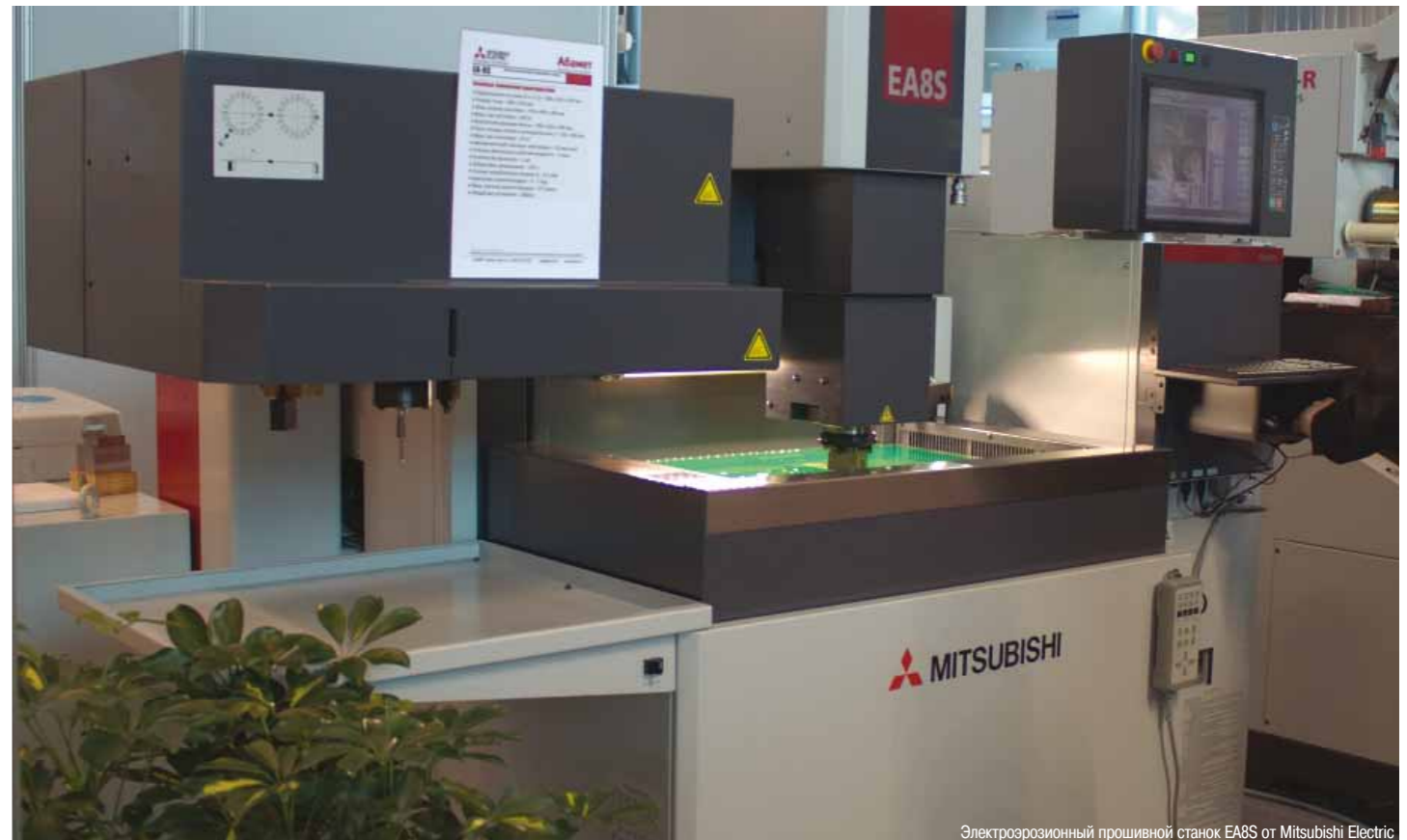
Электроэрозионный прошивной станок EA8S от Mitsubishi Electric